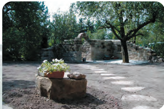
▮ Vegetationsfläche frisch eingesät ▮ Bogen und Ruinenmauer mit integriertem Sitzplatz aus handgeschlagenen Sandsteinblöcken