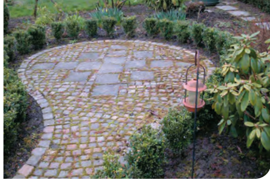
▮ Kleine Gartennischen-Kombination aus gebrauchten Betonplatten mit Natursteinpflaster