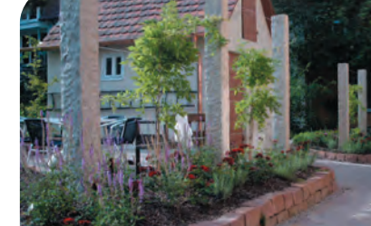
▮ Granitsäulen mit Edelstahlverbindung