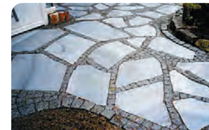
▮ Kombination Wachhauer Kristallin polygonal Platten mit Bayerischem Granitpflaster