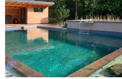
I Naturpool – Schwimmteich