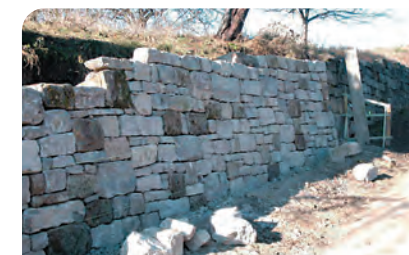
▮ Komplettsanierung einer denkmalgeschützten Trockenbaumauer ▮ Natursteinterrasse polygonal Verband