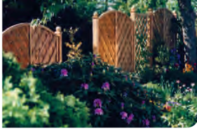
I Kombination aus Holz-Sichtelementen und Bepflanzung